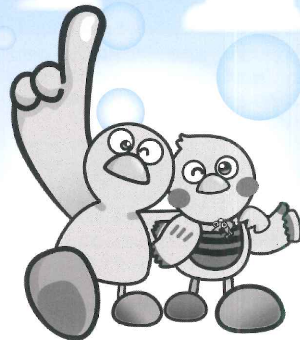
埼玉県のマスコット「コバトン」・「さいたまっち」