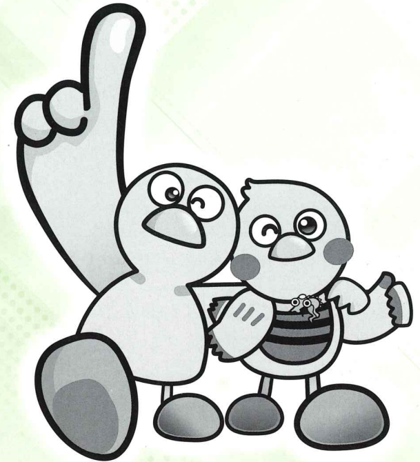
埼玉県のマスコット「コバトン」・「さいたまっち」