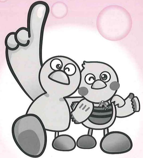
埼玉県のマスコット「コバトン」・「さいたまっち」